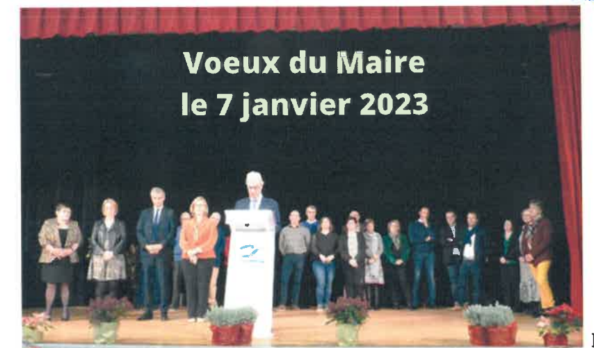
Voeux du Maire le 7 janvier 2023