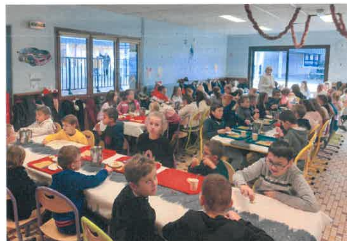
Des enfants ravis de passer du bon temps à la cantine