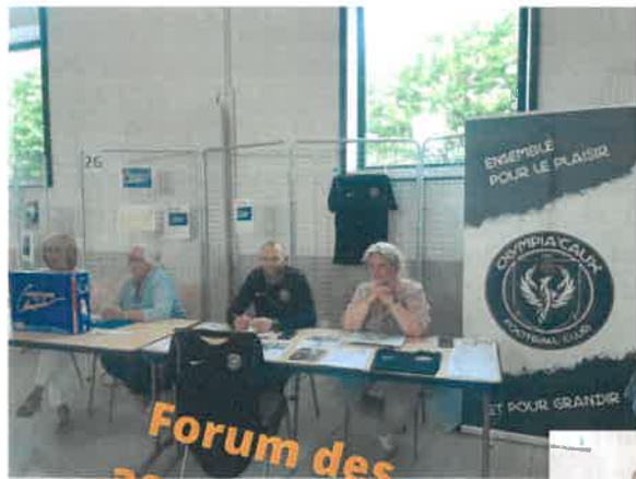
Forum des associations le 3 septembre 2022