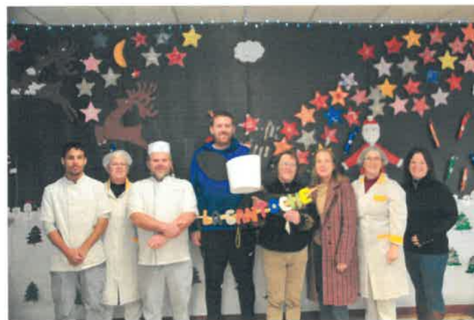
L'équipe de restauration scolaire devant le calendrier de l'Avent géant réalisé par les enfants de « la cantoche »

Encore une bonne raison pour eux de « manger à la cantine, avec les copains et les copines » !