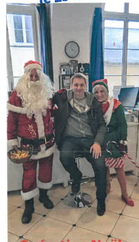
Opération Noël décembre 2022