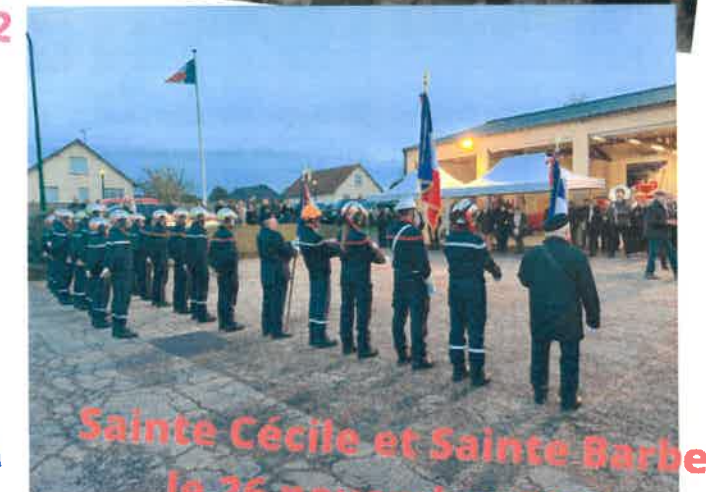
Sainte Cécile et Sainte Barbe le 26 novembre 2022