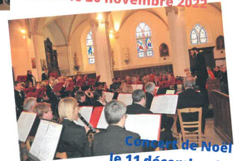
Concert de Noël le 11 décembre 2022