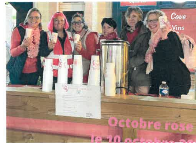
Octobre rose le 10 octobre 2022