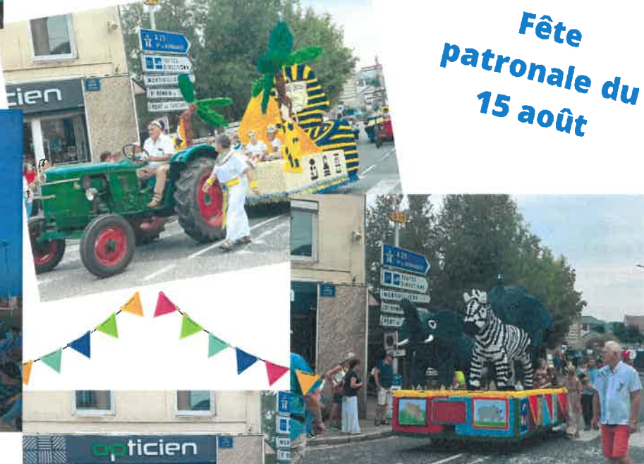
Fête patronale du 15 août