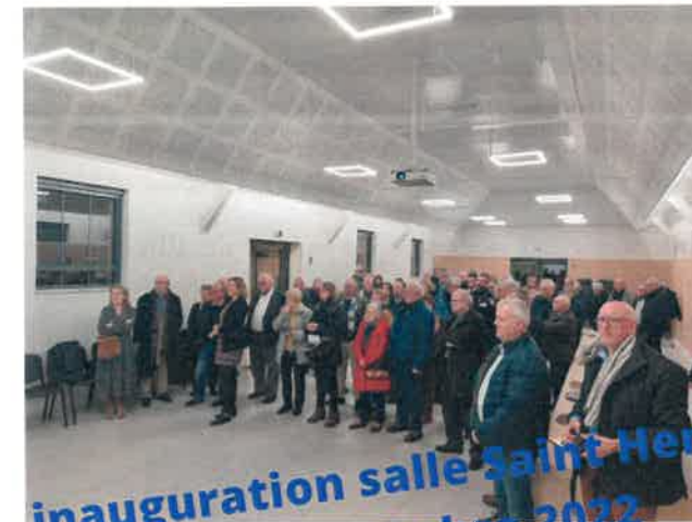
inauguration salle Saint-Henri le 25 novembre 2022