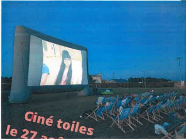
Ciné toiles le 27 août 2022