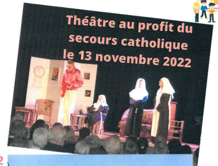
Théâtre au profit du secours catholique le 13 novembre 2022