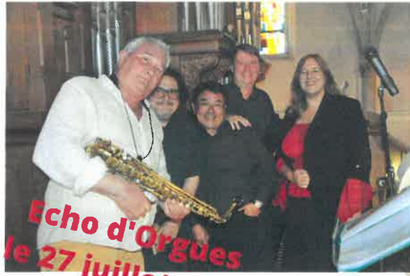
Echo d'Orgues le 27 juillet 2022