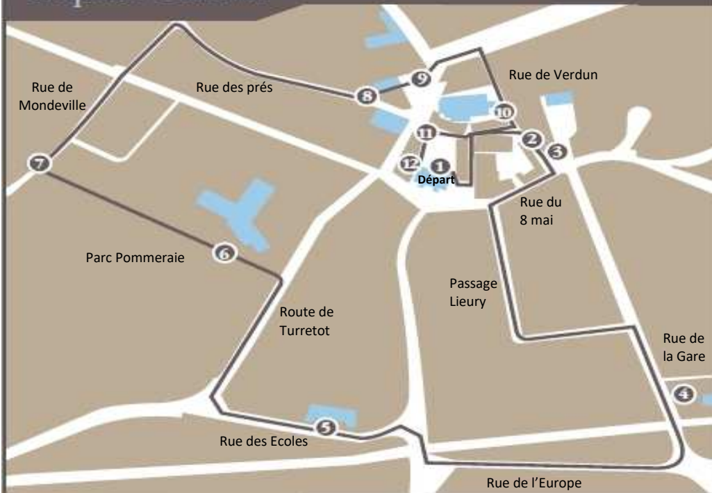
Extraits tirés des totems