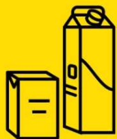
Emballages et briques en carton