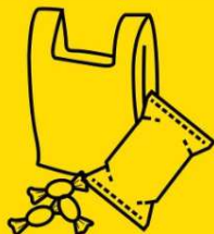
Sacs et sachets plastiques