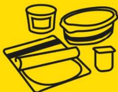
Barquettes, pots et boîtes