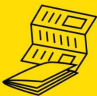
Papiers, journaux et magazines